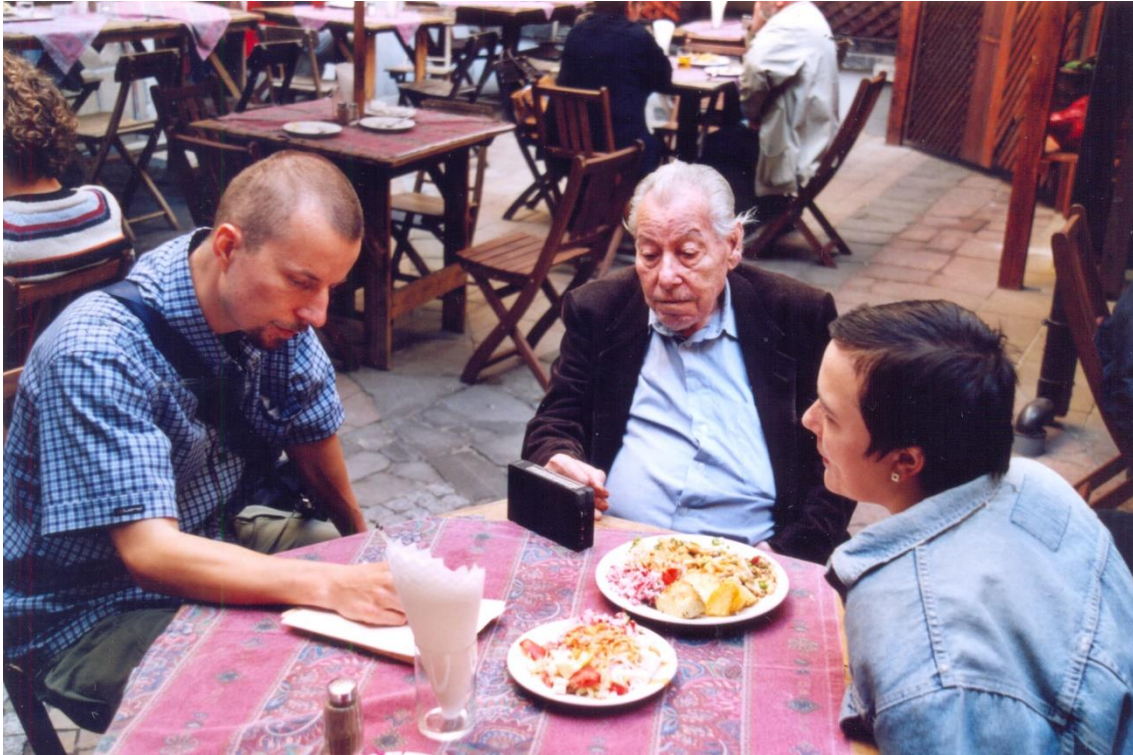
Abel Paz en una entrevista en Krakov. Polonia en el momento de una entrevista con la prensa 2-10-2003